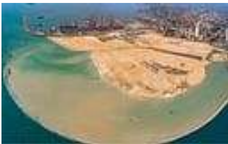
இலங்கையில் சீனாவின் தீவு... எப்படிச் சமாளிக்கப் போகிறது இந்தியா?

ஒரு கிலோ உளுந்து இந்திய மதிப்பில் 400 ரூபாய்க்கு விற்பனையாகிறது. அந்த விலைக்கு விற்காலும் கடும்தட்டுப்பாடு நிலவுகிறது. சிறுதானியங்கள், அரிசி அனைத்திற்கும் கடுமையான தட்டுப்பாடு நிலவுகிறது. அதன் காரணமாக விலையும் அதிகரித்துக் கொண்டே போகிறது. 100 கிராம் மஞ்சள் இந்திய மதிப்பில் 300 ரூபாய்க்கு விற்பனையாகிறது.